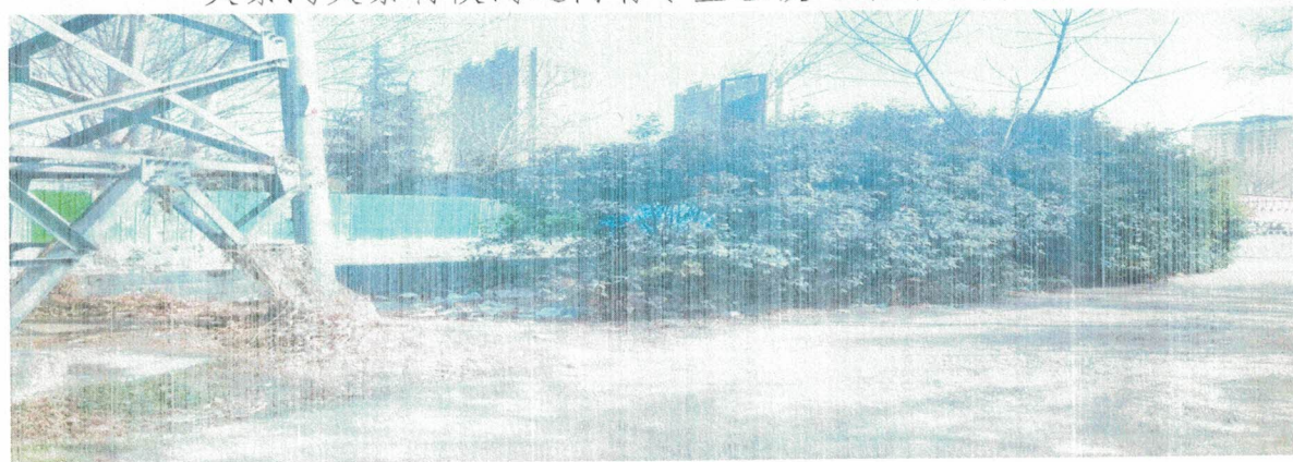
煤泥河建设路北侧有生活垃圾一堆（鸿鹰街道）