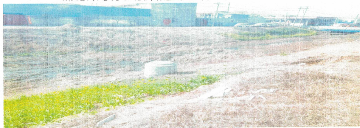
月台河平安大道南有建筑垃圾一堆（东高皇街道）