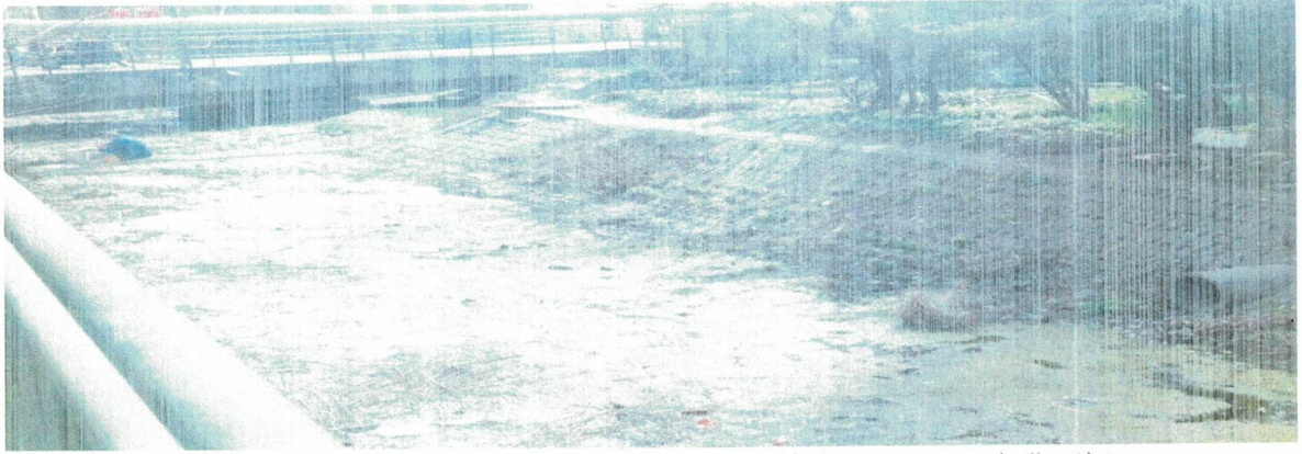
城东河康馨花园北门河道内有零星垃圾（五一路街道）